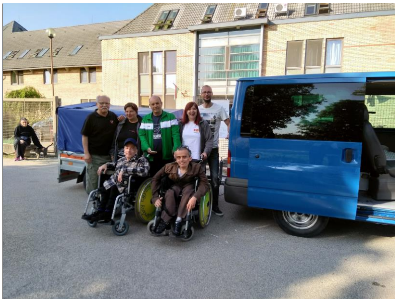
1. ábra - Indulás pillanata Tordasról